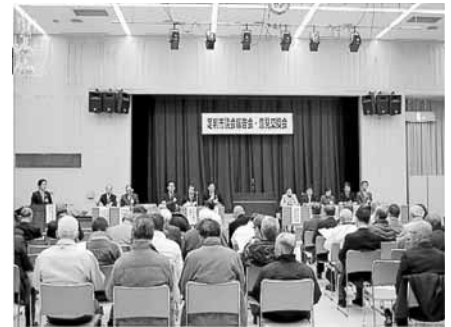
(11/20 市民プラザ小ホール)