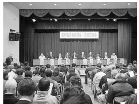
(11/27 市民会館小ホール)